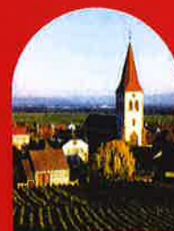
L'église saint-Martin à Ammerschwihr, dans le Haut-Rhin.

Martin a voyagé en Gaule et dans plusieurs pays d'Europe. Grâce à ses paroles et à ses actes, beaucoup de gens des villes et des campagnes ont découvert Jésus et ont demandé le baptême. La Gaule est devenue chrétienne à cette époque-là.