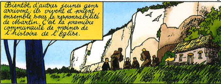
Bientôt, d'autres jeunes gens arrivent; ils vivent et rient ensemble sous la responsabilité de Martin. C'est la première communauté de moines de l'histoire de l'Église.

Eh bien! Je vais l'installer dans la grotte à côté!