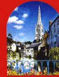
L'église Saint-Martin, à Harfleur, en Normandie.