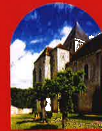
L'église Saint-Martin, à Plaimpied-Givaudins, dans le Cher.