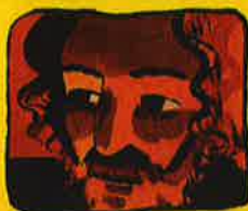
Nous savons peu de choses sur Moïse. S'il a vécu, on pense que c'était vers 1300 avant J.C., peut-être sous le règne du pharaon Ramsès II.

Dans ce récit, Moïse demande à Pharaon la liberté pour son peuple de célébrer Yahvé, son Dieu. Mais Pharaon, qui croit en ses dieux égyptiens, refuse. Moïse lui annonce alors la colère de son Dieu, prêt à tout pour que les Hébreux soient libres de le prier.