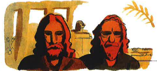
Au même instant, Moïse et Aaron entrent dans la salle d'audience de Pharaon.

Il n'y a rien à espérer. Nous sommes esclaves pour longtemps encore.