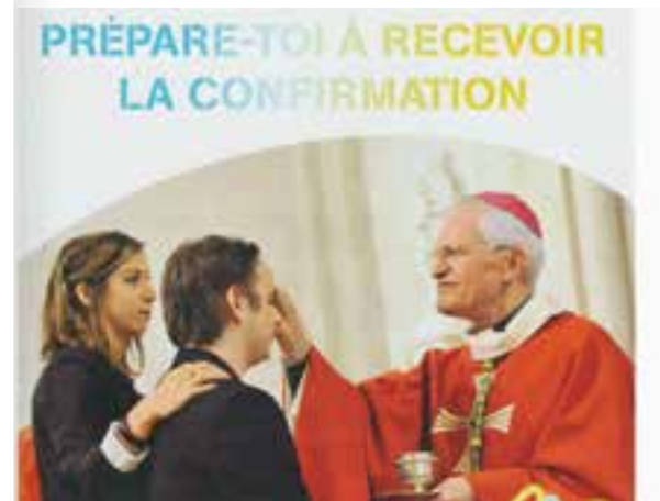
P.5 | Sois marqué de l'Esprit saint, le don de Dieu.