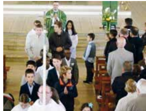
Les communicants et les confirmands du 9 octobre à la fin de la célébration.

Et enfin, les 9 et 23 octobre, certains jeunes ont reçu le sacrement de l'eucharistie ou ont fait leur profession de foi.