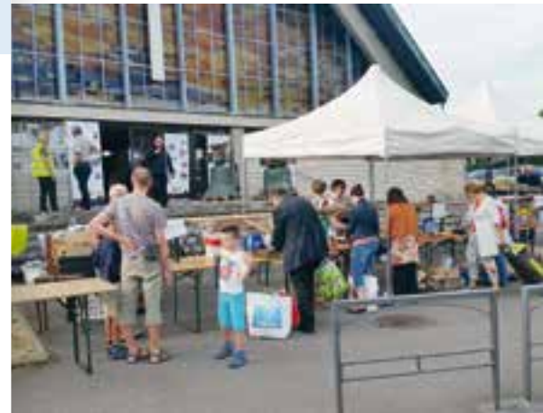
P.4 | Le stand de la paroisse lors de la brocante du 11 septembre 2016.