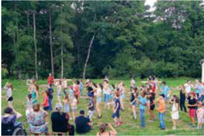
Chorégraphie à la colo.

Belle année 2016 avec cent vingt enfants accueillis à la colonie des Basses-Pierres (Vosges) et quelques retardataires refusés, hélas, faute de place.