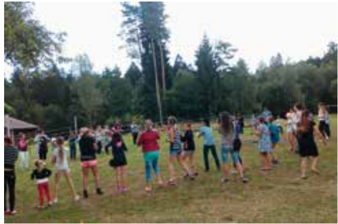
Un groupe de colons en activité.

Les enfants ont vécu trois semaines à cent à l'heure avec une succession d'activités tant intellectuelles que sportives ou de détente : balades en VTC, camping, randonnées, canoë et voile sur le lac de Pierre-Percée, initiation au poney à Gérardmer et toutes sortes de grands jeux de plein air, sans oublier les veillées et les feux de camp. Le clou du spectacle, la grande journée au parc d'attractions de Fraisvert-city, voisin de la colo.