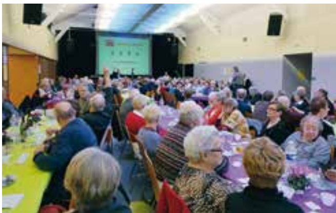
Une partie des convives lors du repas à Maringer.

«Quel plaisir de se retrouver !»; «Ce fut encore une bien belle journée !»