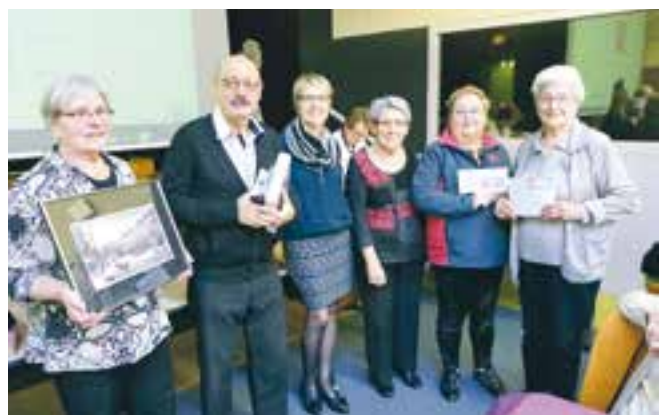
Les gagnants des gros lots de la tombola.

Deux réflexions parmi d'autres, entendues lors de la 13 e fête paroissiale qui s'est déroulée à la salle Maringer avec au menu : de la bonne humeur, des discussions à bâtons rompus, un bon repas, sans