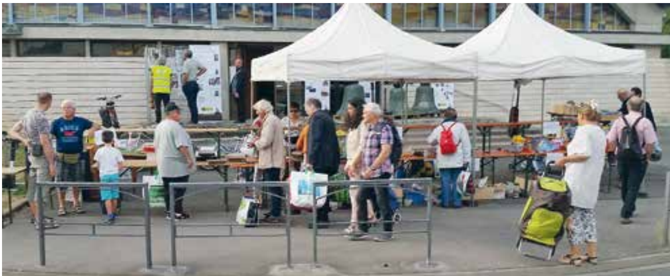
Beaucoup de mouvement sur le stand de la paroisse.

Devant Saint-Pie X, le 11 septembre : presque de la routine... mais aussi trois nouveaux personnages.