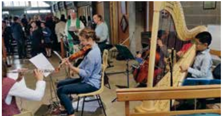
Il n'y a pas d'âge pour jouer de la harpe dans l'orchestre des jeunes.

En ce début de l'année cinq grands événements ont été vécus par les jeunes de la paroisse.