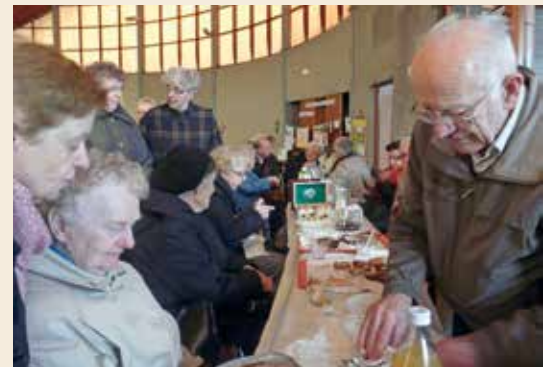
■ Fête du Sem.

Vous pouvez retrouver des reportages détaillés de ces événements sur le site paroissial.