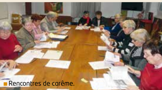
■ Rencontres de carême.

Professions de foi en l'église Saint-Christophe.