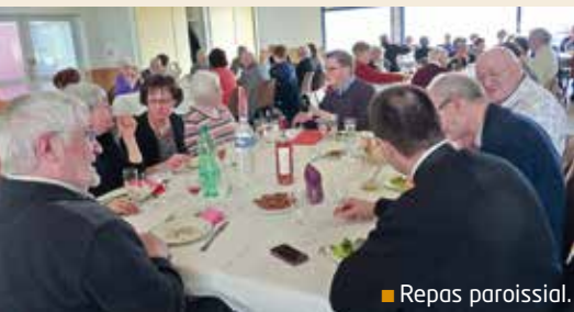
■ Repas paroissial.