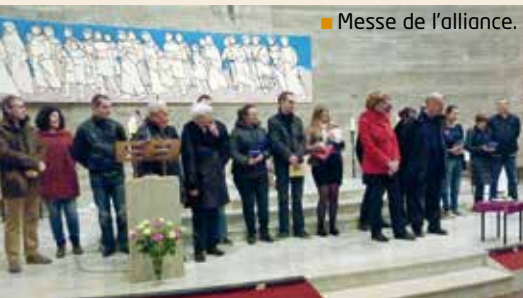
■ Messe de l'alliance.