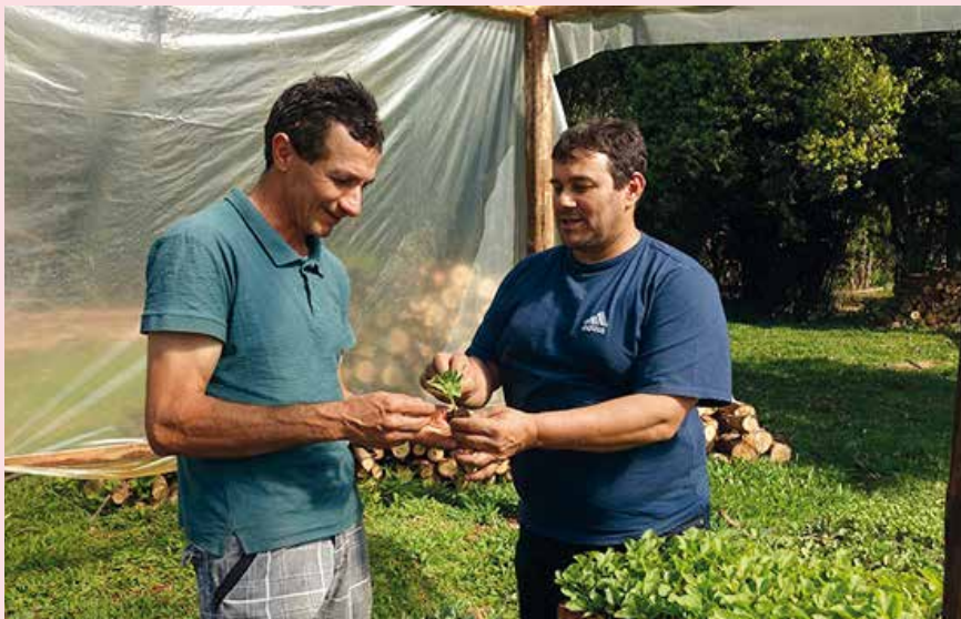
■ Au Brésil, des agriculteurs familiaux résistent depuis cinquante ans à un agro-business destructeurs.

À 13 heures le samedi 25 mars à Sion, un bus où se trouvaient déjà des enfants de Pont-à-Mousson, a pris en charge les enfants du catéchisme de la paroisse. Ils étaient volontaires pour participer à l'événement diocésain "Bouge ta colline", organisé par le CCFD-Terre solidaire (Comité catholique contre la faim et pour le développement).