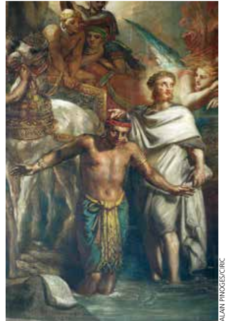
■ Saint Philippe diacre baptise l'eunuque de la Reine d'Éthiopie.

L' épiscopat est bien antérieur à la création des diocèses : la fonction d' évêque remonte aux premières communautés chrétiennes. Le Nouveau Testament emploie épiskopos pour désigner une fonction dans l'Église (1 Tm, 5, 1). Ce mot veut dire "le surveillant". Au I er siècle, l'évêque n'était pas nécessairement un ministère particulier. Ce terme désignait une tâche à accomplir : surveiller, protéger la communauté devant les menaces des hérétiques. Paul s'adresse à "tous les saints (fidèles) de Philippiques, avec leurs évêques et leurs diacres" (Ph 1,1). Les évêques sont les ancêtres des évêques , responsables des diocèses . Paul énonce les qualités requises pour être un bon évêque (Tt 1,7-9). Après Pierre, Lin puis Clet eurent en charge la communauté chrétienne de Rome, dont l'influence s'étendait. La première