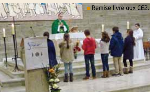
■ Remise livre aux CE2.