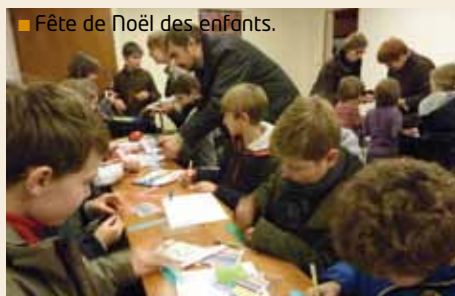
■ Fête de Noël des enfants.