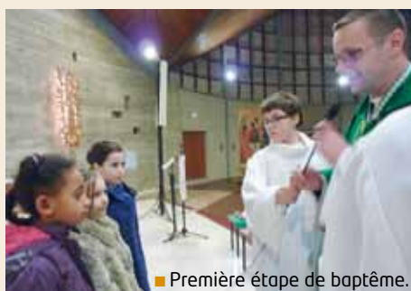
■ Première étape de baptême.