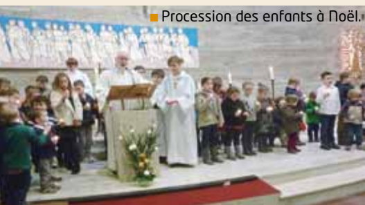
■ Procession des enfants à Noël.

Vous pouvez retrouver des reportages détaillés de ces événements sur le site paroissial.