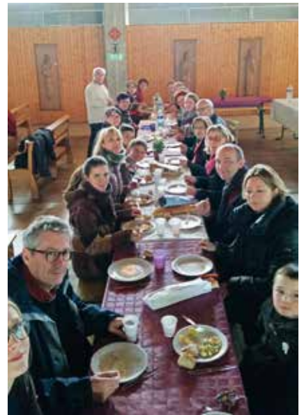
Un moment de convivialité.

Après le bien du corps vient le bien de l'âme. Plusieurs petites équipes ont préparé la liturgie de la messe avec soin et sérieux, car la messe, ne l'oublions pas,