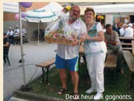
Deux heureux gagnants.