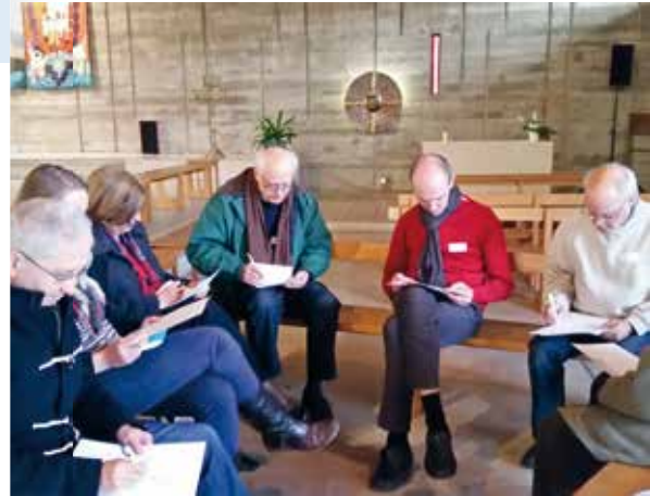
P.4 | Un moment d'échange intense lors du dimanche autrement.