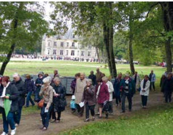
P.5 | Une longue procession à Thillombois lors du rassemblement du Rosaire.