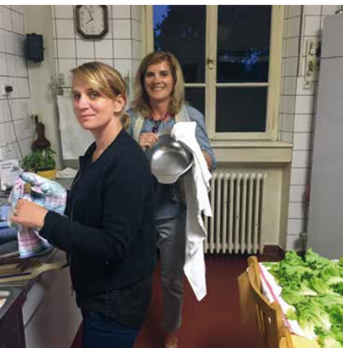
Le service de l'autre vécu par deux catéchistes.