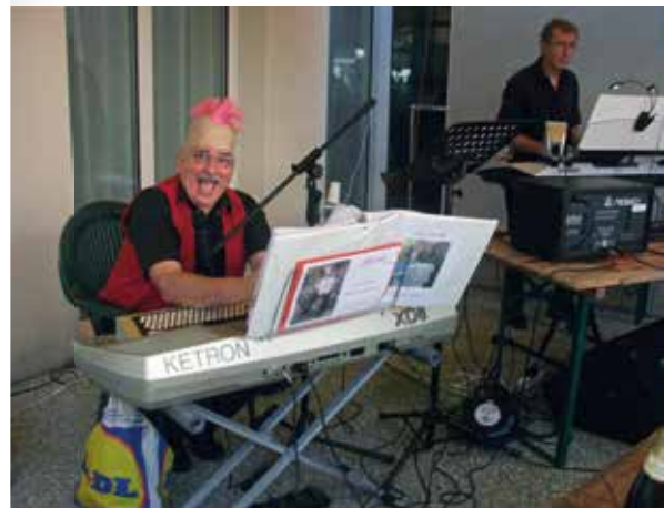
P.8 | Fête du Bas-Château un musicien qui a un fier toupet rouge.