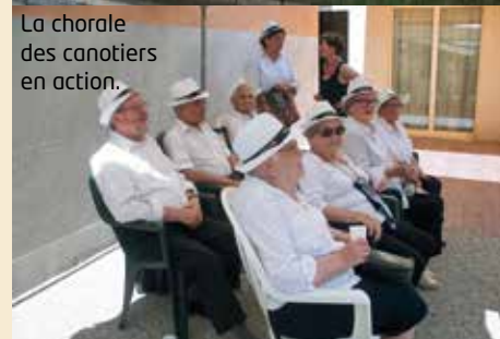
La chorale des canotiers en action.