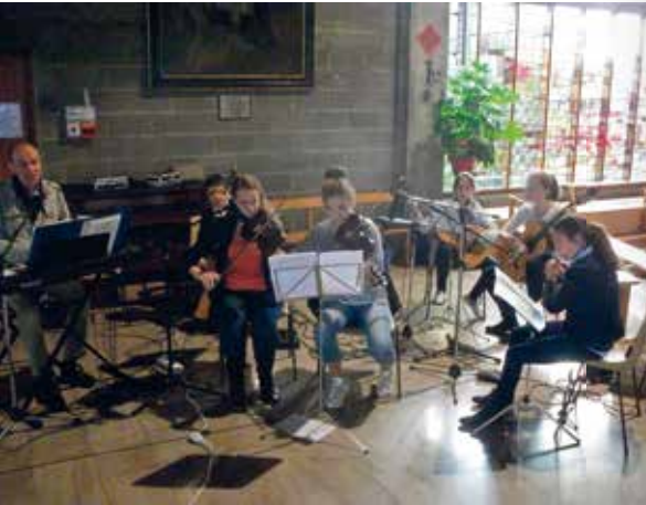
P.3 | L'orchestre des jeunes en pleine action lors de la messe de rentrée.

Journal trimestriel d'informations paroissiales - St. PIE X et St. LUC - St. GEORGES - BAS-CHÂTEAU