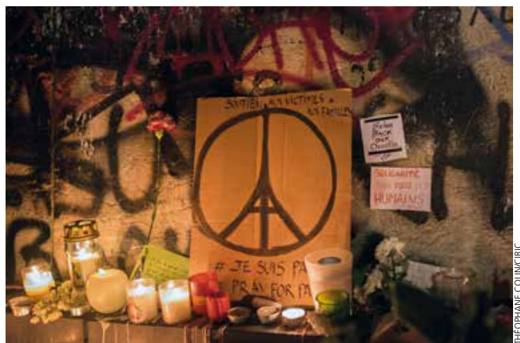
14 novembre, place de la République, recueillement et hommages aux victimes des attentats terroristes perpétrés la veille à Paris.