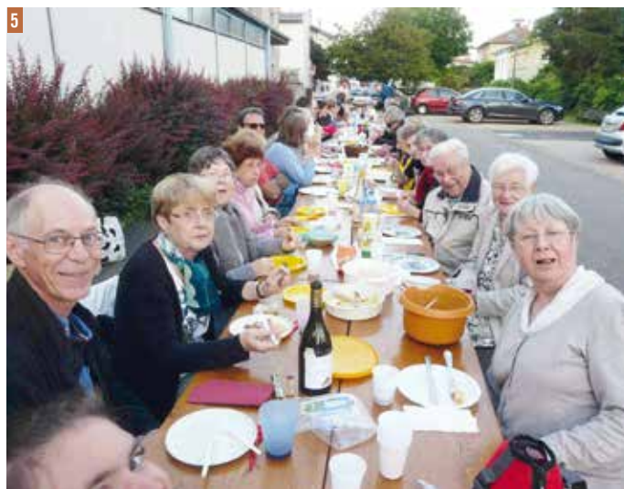
1 Confirmation 2 3 Marche paroissiale