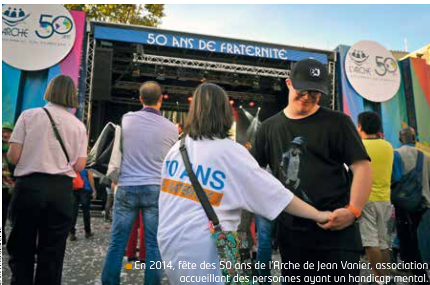
■ En 2014, fête des 50 ans de l’Arche de Jean Vanier, association accueillant des personnes ayant un handicap mental.

“Ressentir la miséricorde, ce mot change tout. C’est ce que nous pouvons ressentir de mieux : cela change le monde. Un peu de miséricorde rend le monde moins froid et plus juste. Nous avons besoin de bien comprendre cette miséricorde de Dieu, ce Père miséricordieux qui a une telle patience...” (Pape François)